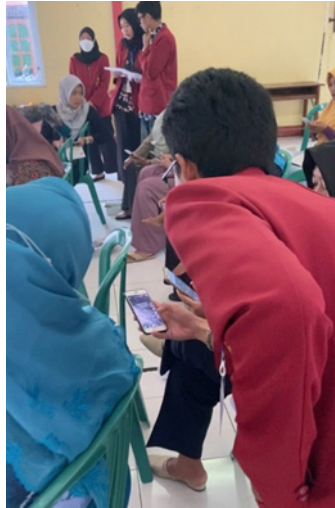
Gambar 1. Sosialisasi Digital Marketing