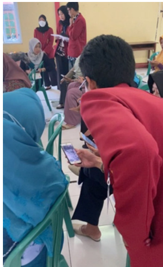
Gambar 2. Pelatihan Digital Marketing

Pelatihan digital marketing merupakan salah satu program kerja pokok dengan target capaian agar pelaku UMKM menguasai penggunaan digital marketing dengan cara mempraktekkan cara pemasaran produk melalui digital marketing agar produk yang mereka miliki mampu menjangkau pasar yang lebih luas[8].