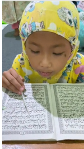
Gambar 3. Penanaman Tanaman Kelor