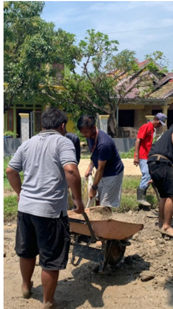
Gambar 5. Kerja Bakti

representasi Universitas Muhammadiyah Yogyakarta dengan masyarakat Desa Grinting Kecamatan Bulakaamba Kabupaten Brebes Jawa Tengah.