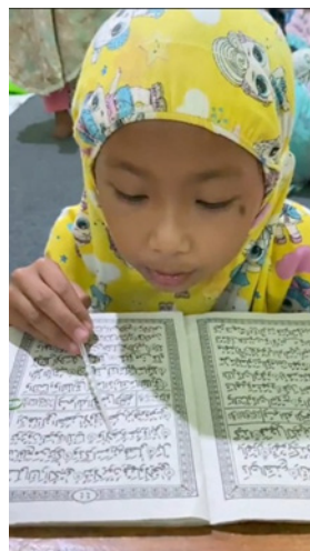
Gambar 4. Taman Pendidikan Al-Qur'an

Terdapat beberapa TPA di Desa Grinting yang memiliki anggota atau anak-anak yang cukup banyak. Pada program bantu ini, tim pengabdian membantu dan berpartisipasi pada program menambah ketertarikan anak-anak dalam belajar. Jadi tidak hanya membaca Al-qur'an saja melainkan juga menulis dan bercerita tentang arti surah pendek, doa sehari-hari atau cerita tentang para nabi atau malaikat[9]. Kegiatan ini tentunya sangat membantu anak-anak TPA dalam mempelajari al-quran karena tidak melulu hanya belajar membaca Al-qur'an saja.