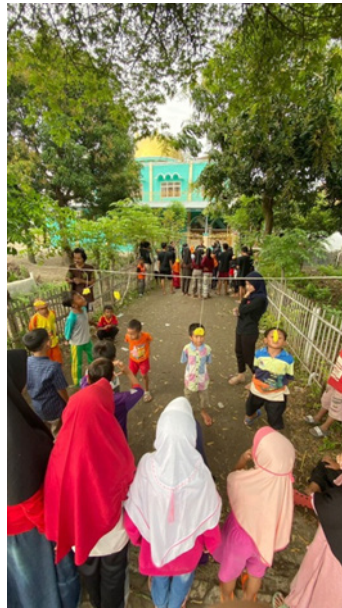
Gambar 7. Panggung Ekspresi

Panggung ekspresi merupakan kegiatan yang sarannya adalah anak-anak. Kegiatan yang dilakukan disini berupa perlombaan, diantaranya adalah lomba makan kerupuk, pecah balon berpasangan, dan estafet tepung. Pada saat pelaksanaan program ini anak-anak sangat antusias untuk mengikuti perlombaan, hal tersebut tentunya karena didukung dengan konsep yang dibuat dengan semenarik mungkin ditambah lagi dengan adanya berbagai macam hadiah untuk anak-anak.