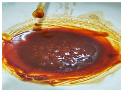
Gambar 1. Hasil Pembuatan Ekstrak Etanol Biji Pala untuk Uji Skrining Fitokimia dan Standarisasi Parameter Spesifik dan Non-Spesifik

Pala merupakan komoditas rempah asli Indonesia yang berasal dari Kepulauan Maluku, Indonesia. Bagian yang sering digunakan adalah bagian bijinya. Kandungan yang terdapat dalam biji pala antara lain minyak atsiri, minyak lemak, saponin, miristin, elemis, enzim lipase, pektin, hars, zat samak, dan asam olenoat. Pada biji pala juga diketahui memiliki kandungan metabolit sekunder berupa alkaloid, flavonoid, saponin, tannin, fenol, dan terpenoid yang dapat memiliki efek terhadap penyembuhan luka 16 . Biji pala (Tabel 1), memiliki karakteristik bentuk biji kecil, bulat telur, kulit ari berwarna putih kekuningan kemudian berubah menjadi merah tua, mengkilat dan berbau wangi, berwarna hitam kecoklatan. Akar tunggang warna putih susu. Berdasarkan hasil uji pembuatan ekstrak biji pala dan uji skrining fitokimia dengan cara kualitatif, uji standarisasi mutu ekstrak secara spesifik dan non spesifik. Ekstrak Etanol Biji Pala yang disingkat menjadi EEBP, dari proses ekstraksi diperoleh hasil rendemen ekstrak yaitu 8,5%. Adapun perolehan EEBP dapat dilihat pada Gambar 1.